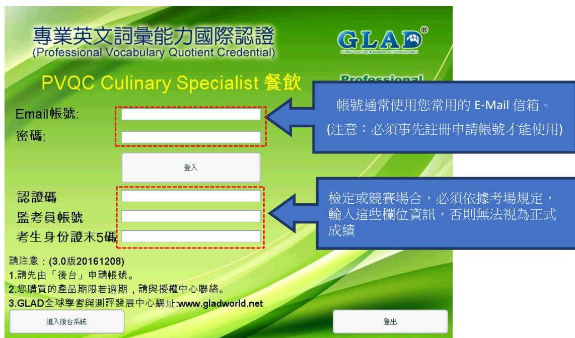
圖 1 PVQC 測評系統登入畫面